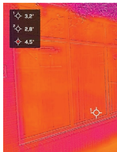
Warmtemetingen, hoe lichter, hoe warmer: 1e foto achterzijde naast de bar; 2e foto boekenkast; 3e foto binnenzijde 'Sandipassage'.